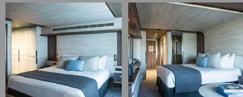
船室例) プレステージ スイート

上質さに包まれたあなただけの客室空間が、極地探検から戻った心と身体を最上級のリラックスへと導きます。優雅で快適な客室は、いずれもプライベートバルコニーを完備しています。