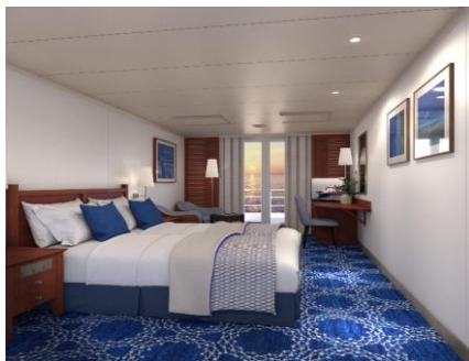
バルコニー付 BA キャビン