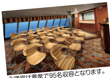
会議室は着席で95名収容となります。