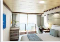
海側バルコニー(約20㎡) シャワー/バルコニー付