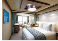
ジュニア・スイート(約23㎡) バスタブ/バルコニー付