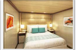
内側(約14㎡) シャワー付/窓なし